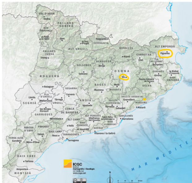
MAPA 3 Zonas de estudio en Cataluña: Vic, Figueres y Cinc Sènies