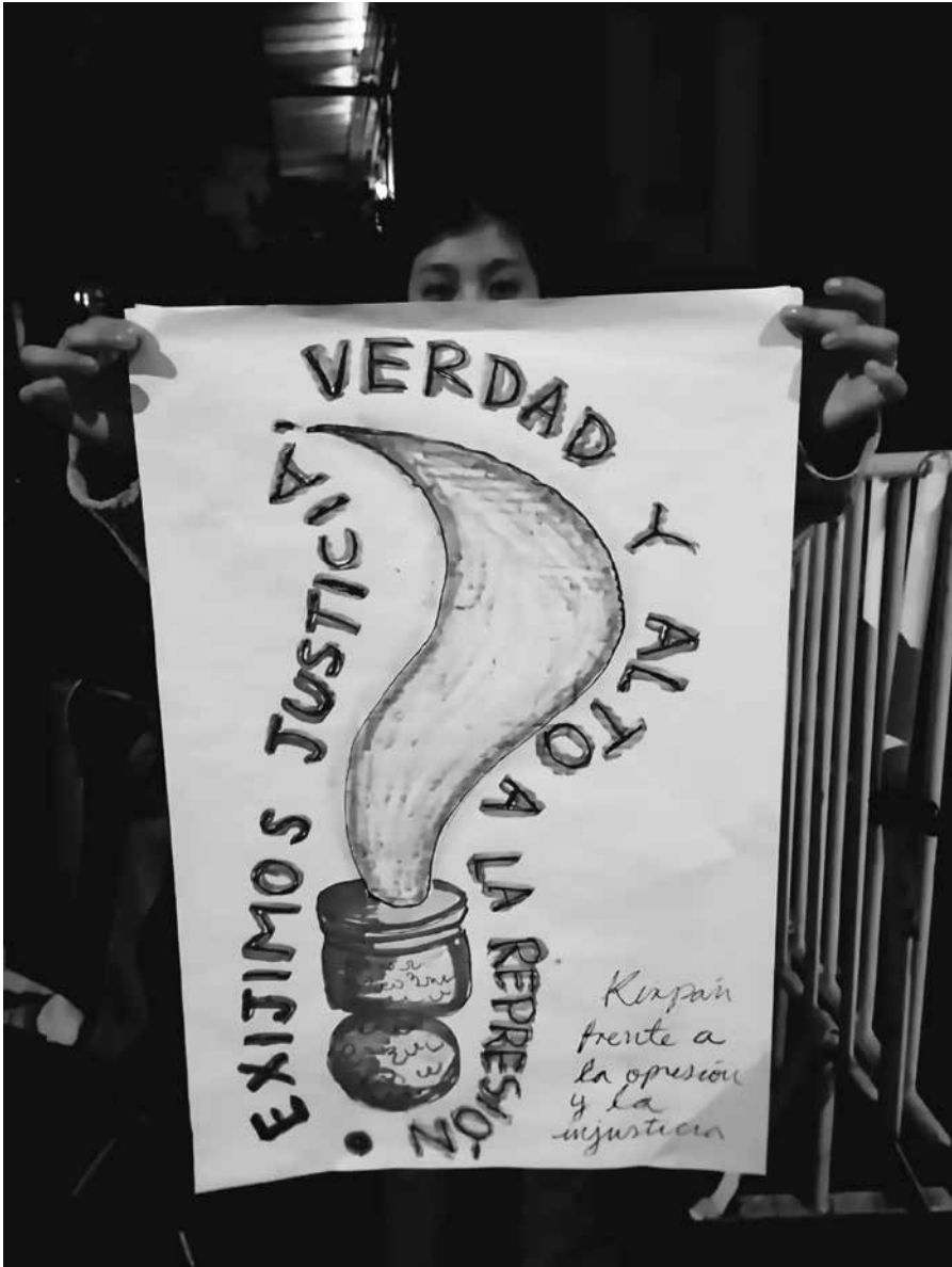
Kirpan contra la injusticia y la opresión Cartel de una serie realizada en conjunto con las compañeras de Guerrero, víctimas de desplazamiento, feminicidio y represión policial. Plantón afuera de la Segob, verano de 2023.