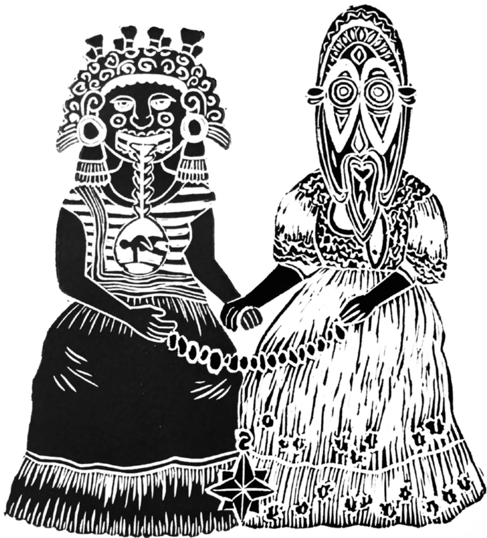
Las dos Fridas, 2022 Linografía, 20 x 25.5 cm