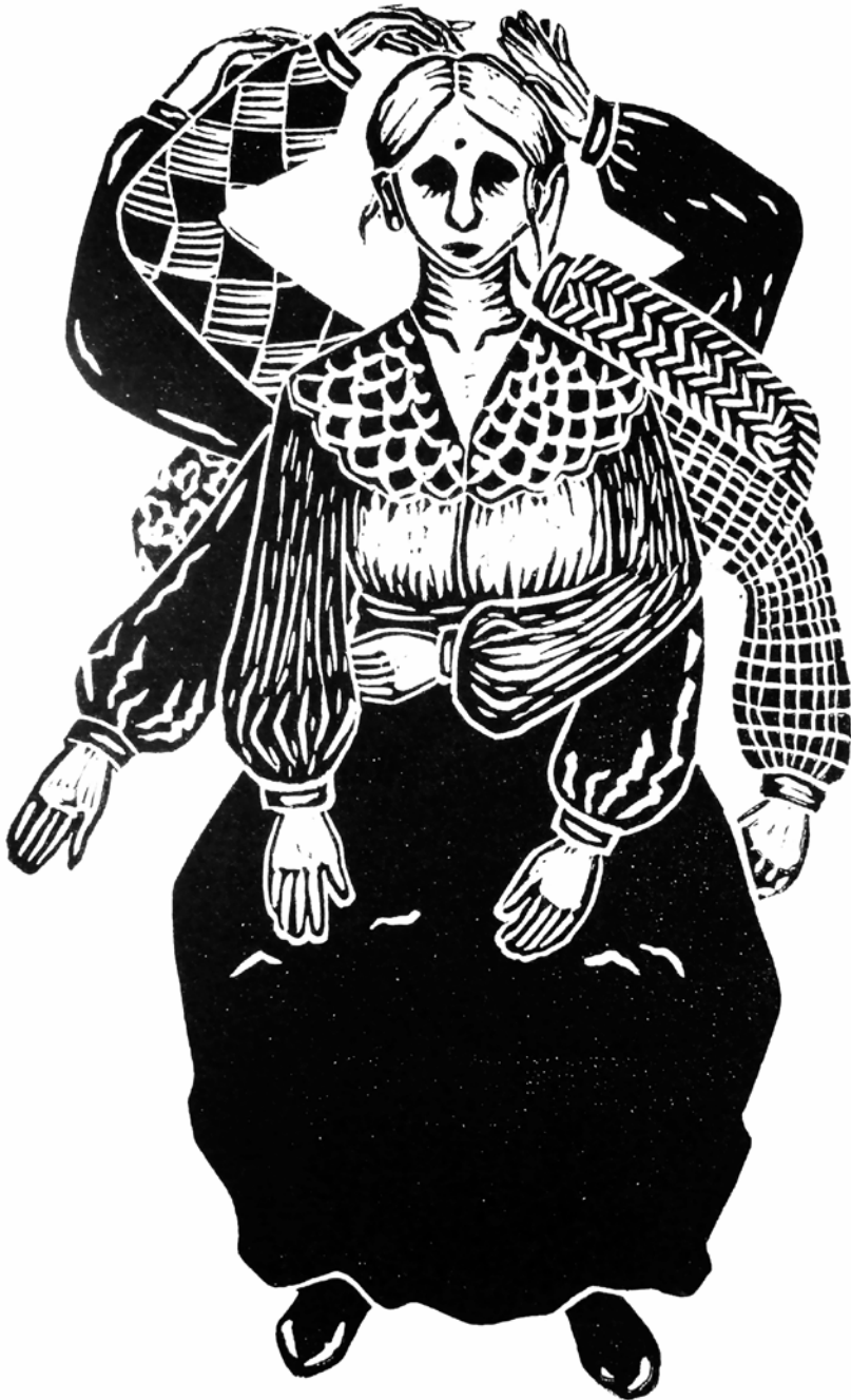
Tatarabuela, 2022 Linografía, 28 x 20 cm