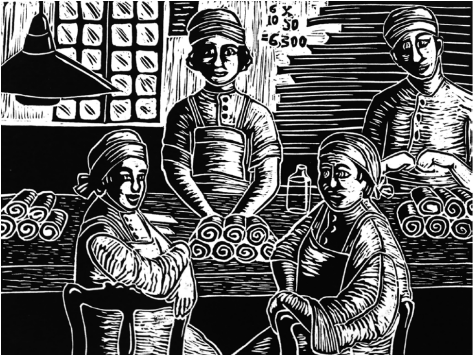
Cigarreras planeando huelga, 2022 Linografía, 26.5 x 20 cm