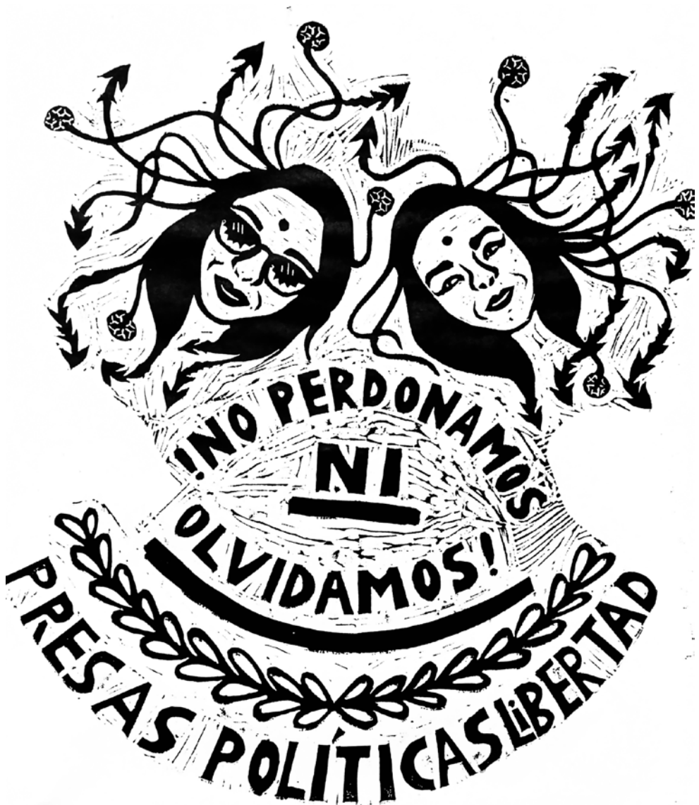
Presas políticas libertad, 2023 Linografía, 20 x 30 cm