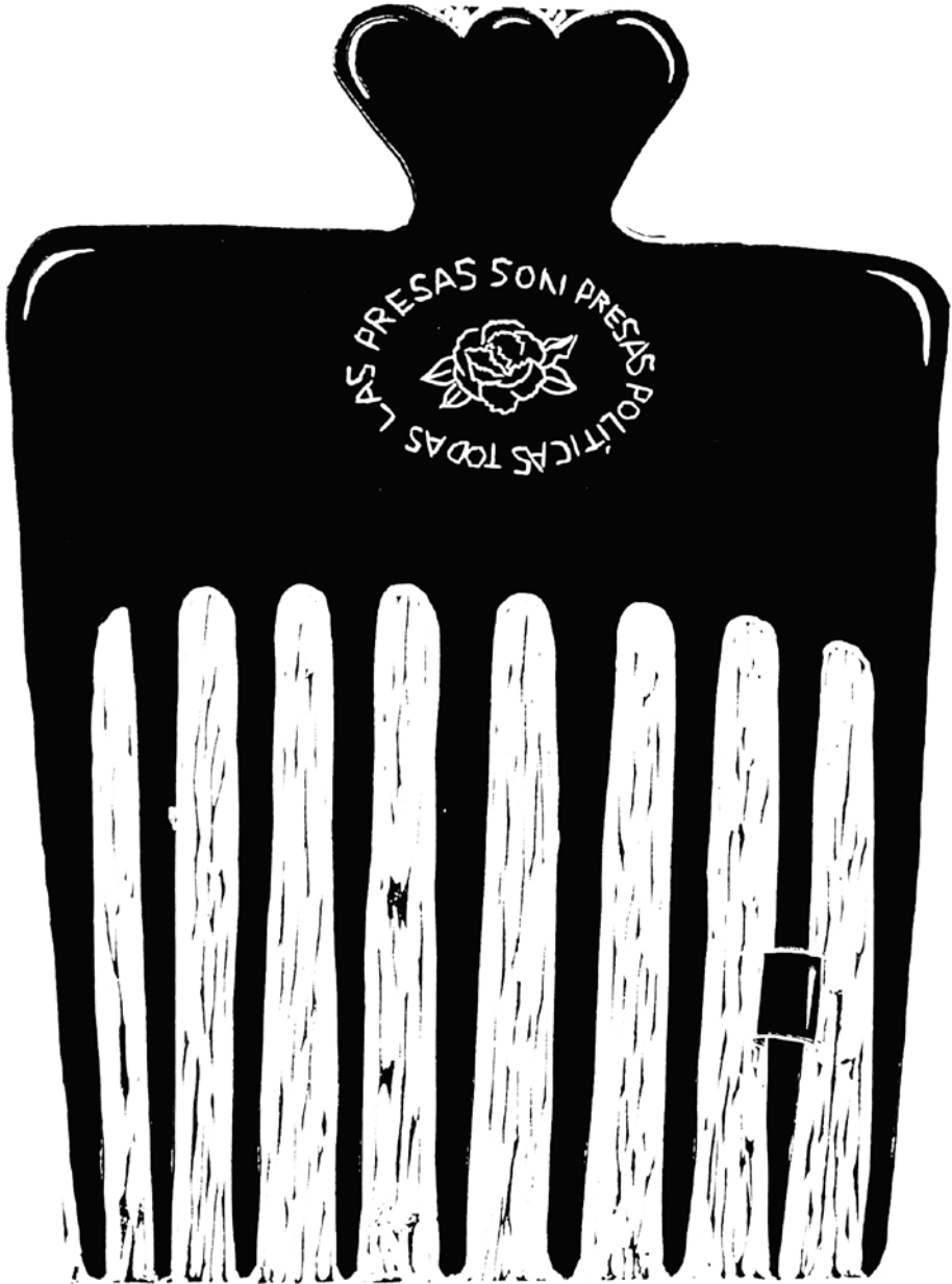
Peineta, 2022 Linografía, 20 x 26.5 cm