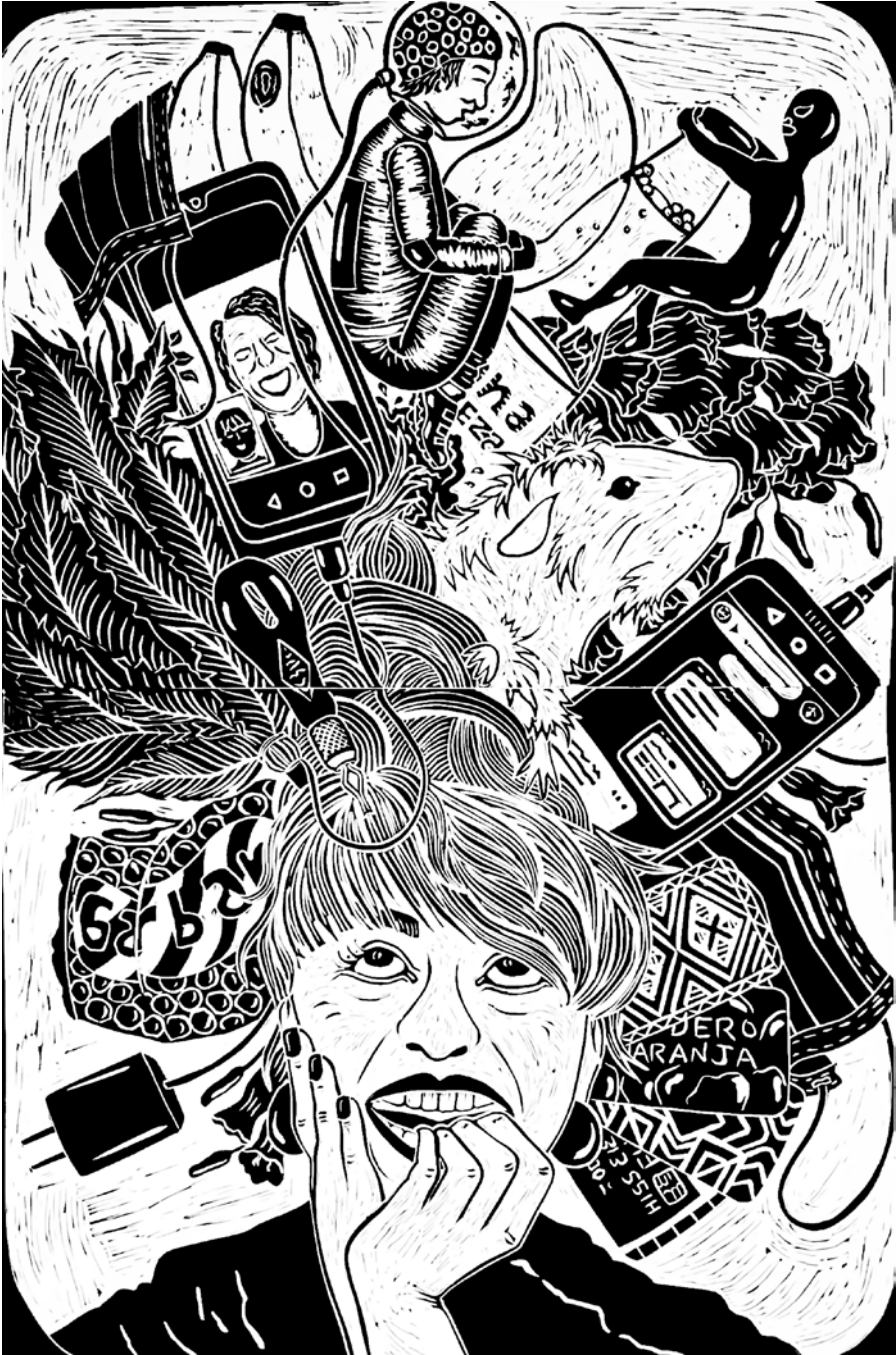
Crónica pandémica, 2022 Linografía, 60 x 40 cm