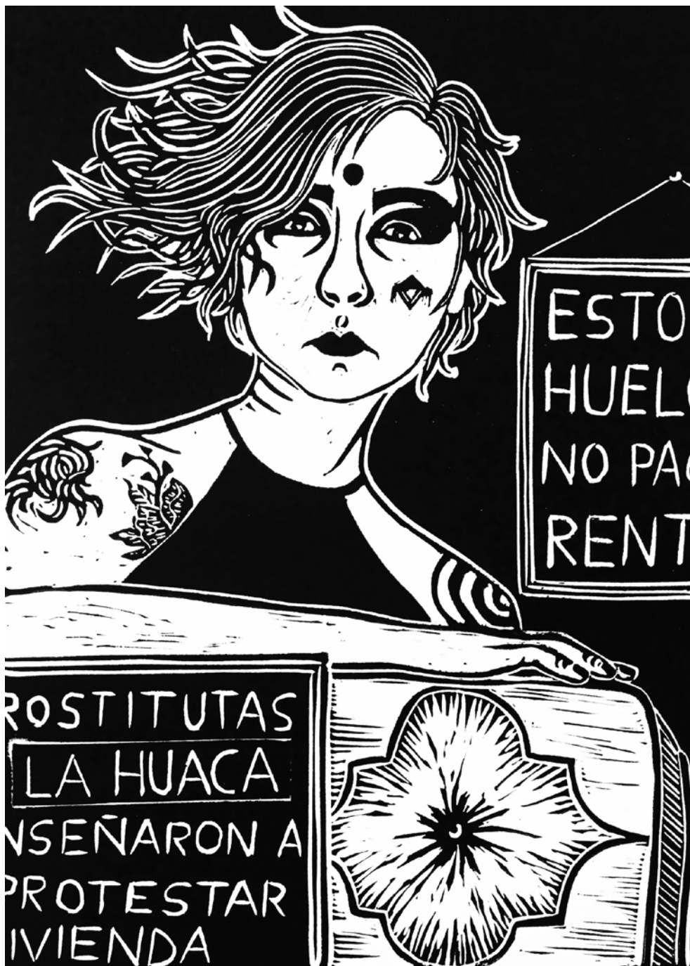
Por La Huaca, 2022 Linografía, 20 x 26.5 cm