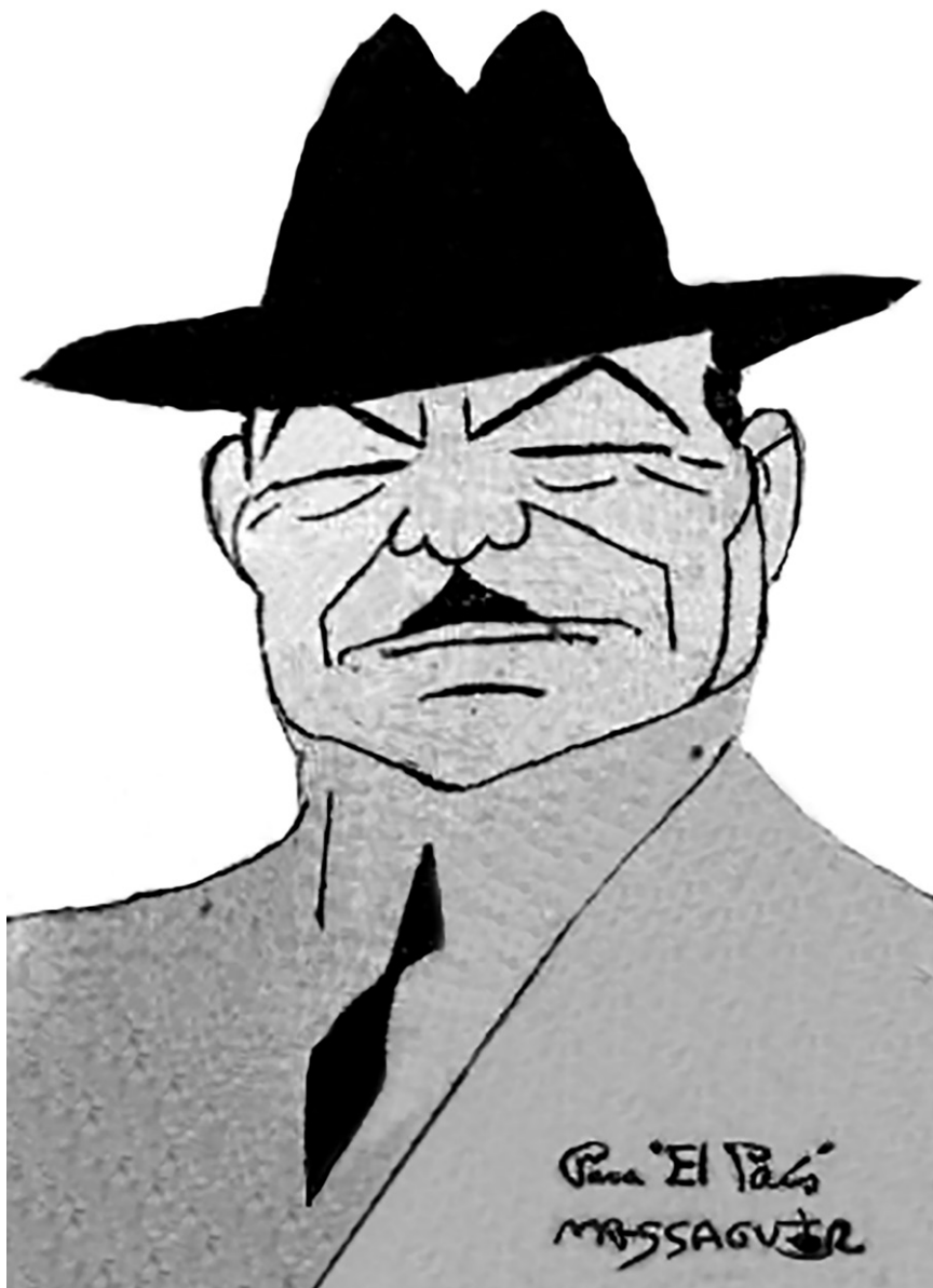
Imagen 3. "El general Calles". ("Cables procedentes de la ciudad de México informan que acaba de descubrirse allí un complot en contra de la vida del General".)