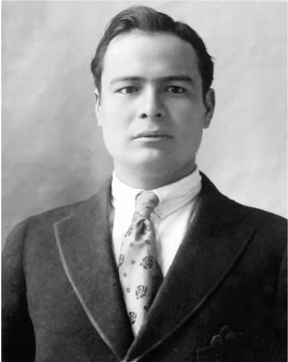
Imagen 1. Juan de Dios Bojórquez, ministro de México en Cuba