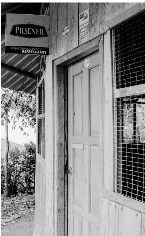
Figura 14: la cerveza del Ecuador