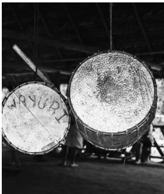
Figura 6: tambores con nombre Wayuri