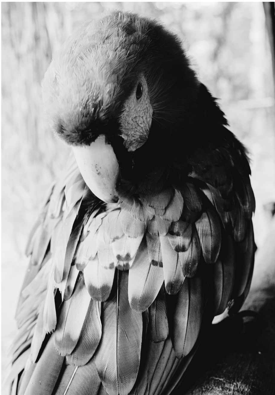
Figura 16: animales típicos de Vencedores