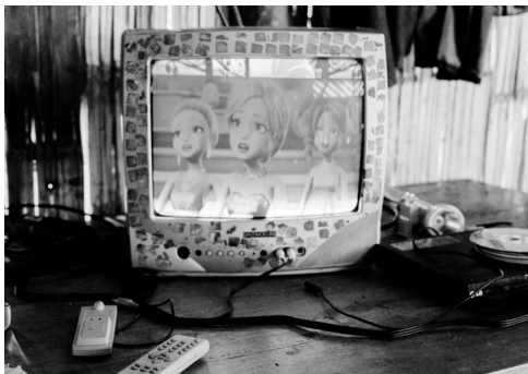
Figura 13: barbie en la televisión