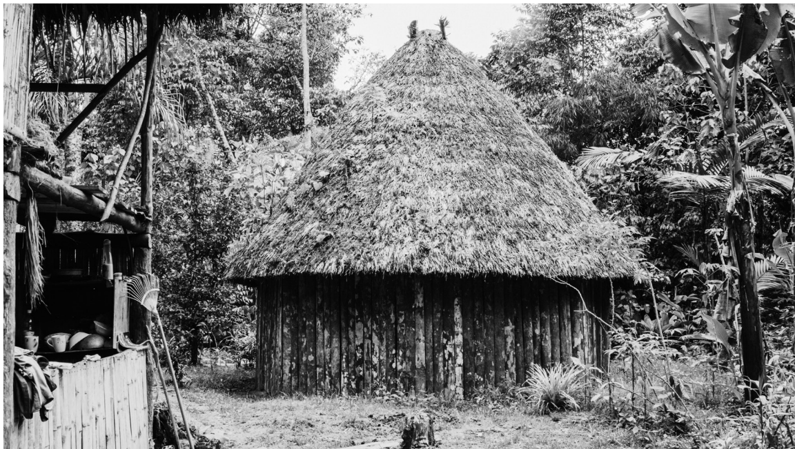
Figura 3: choza enana en comunidad Wayuri