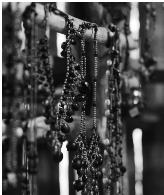
Figura 5: artesanías