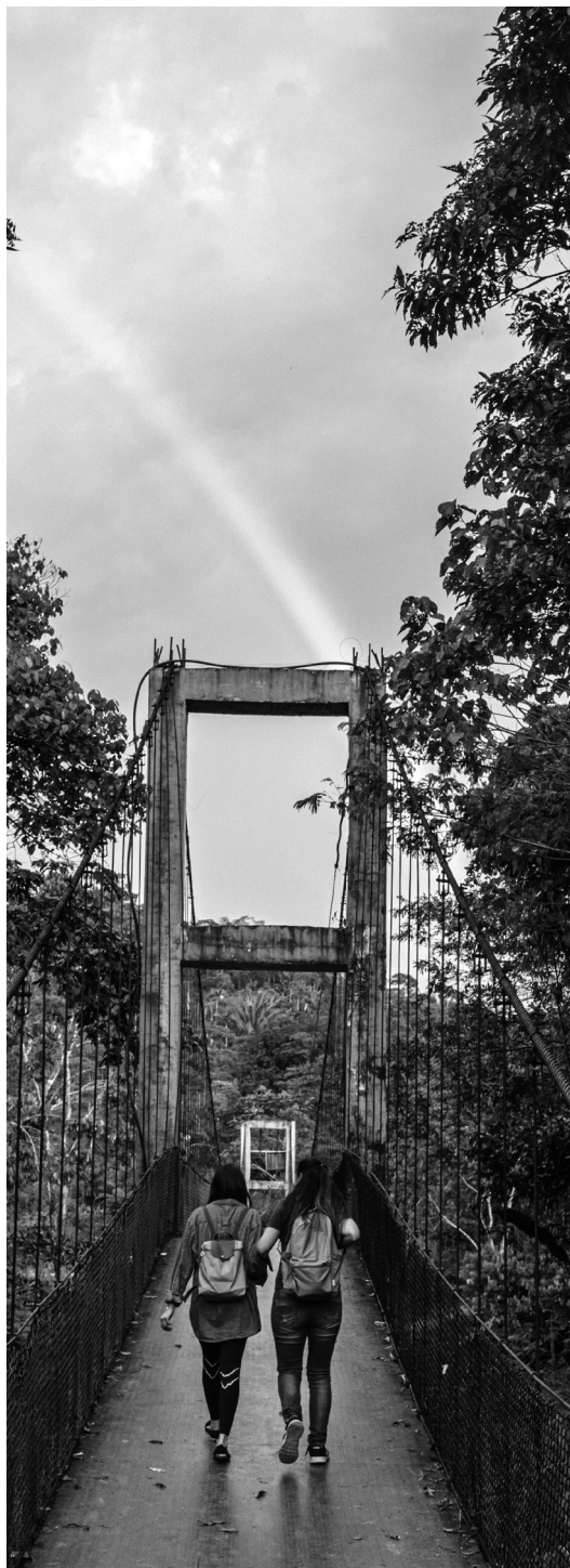
Figura 2: investigadoras cruzando el río