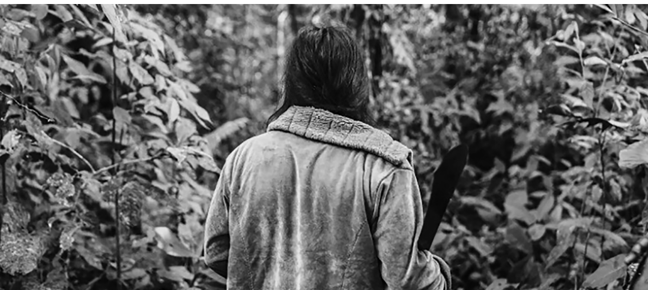
Figura 1: Mujer con machete

Finalmente queremos destacar la necesidad de visualizar el territorio en este tipo de estudios decoloniales por la capacidad que tiene de mantener vigentes discursos otros, saberes otros y prácticas otras . Se le asigna al espacio físico entendido como territorio la capacidad de mantener vivas estas formas otras de ser, permitiendo que sus identidades persistan y resistan a la influencia colonial. También se reconoce el peso simbólico y cultural que trae consigo el espacio. Durante esta experiencia hemos podido comprender el la construcción de fronteras simbólicas entre Vencedores y Puyo, la atribución de significados a cada territorio y creemos que es necesario profundizar en las hibridaciones y las formas de contagio cultural que se dan en las comunidades indígenas.