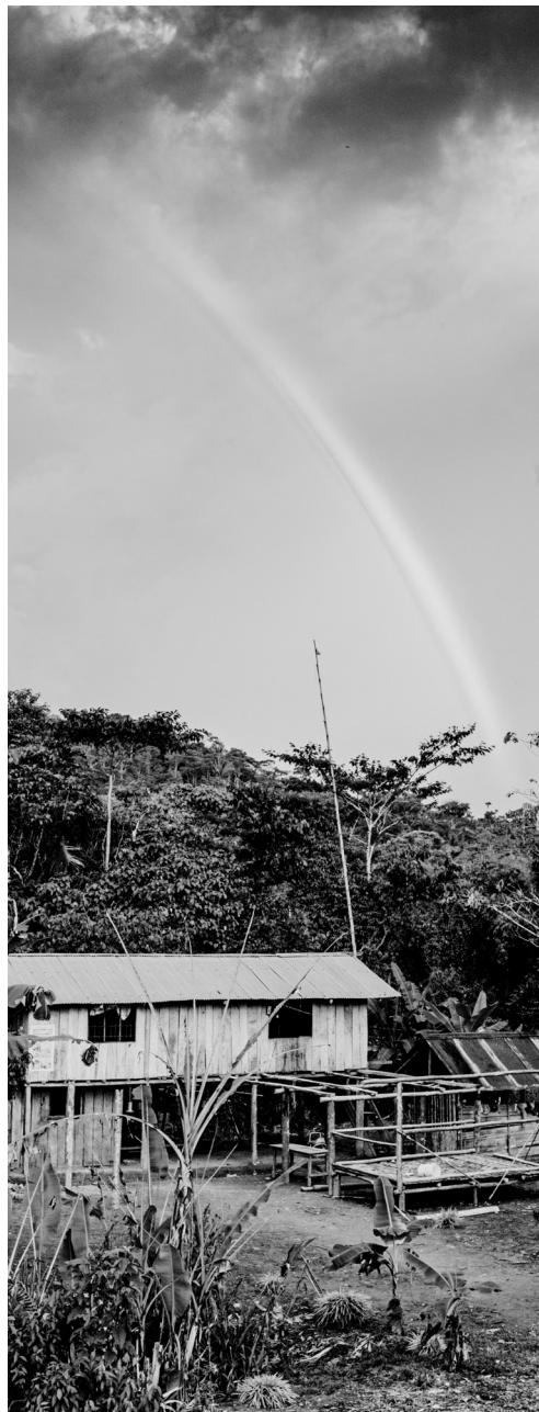
Figura 15: Wayuri en el encuentro del sol y el agua