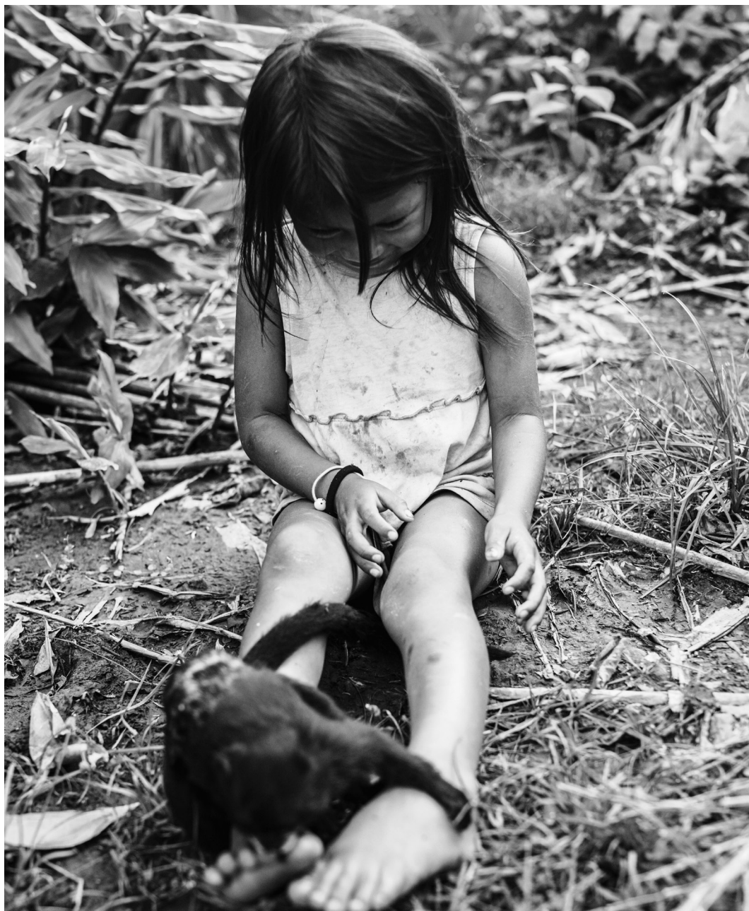
Figura 12: niña en su entorno comunitario