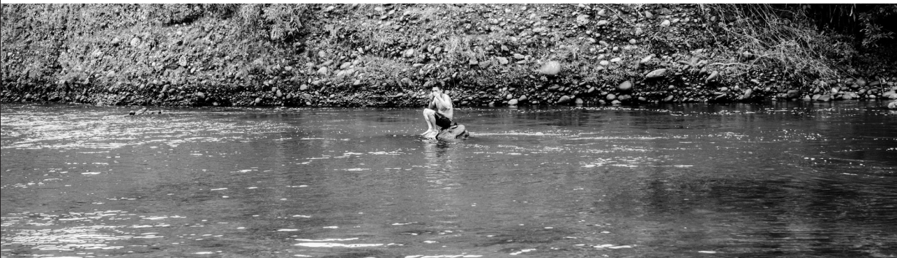
Figura 9: el río