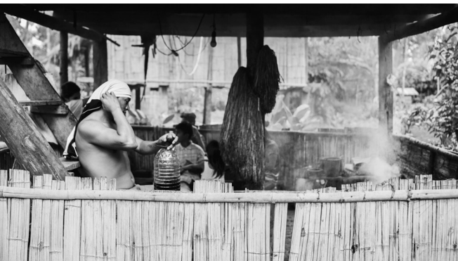
Figura 8: en casa