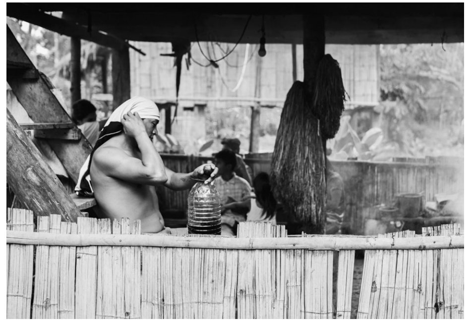
Figura 8: en casa