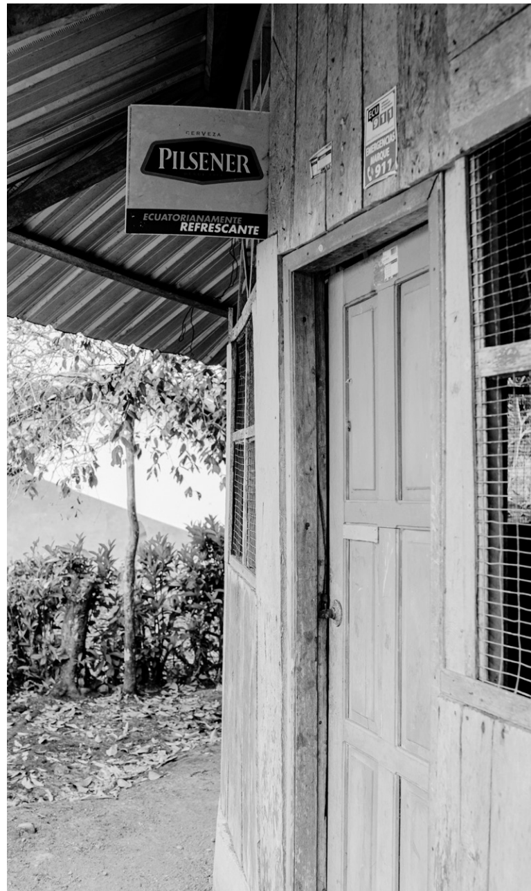
Figura 14: la cerveza del Ecuador