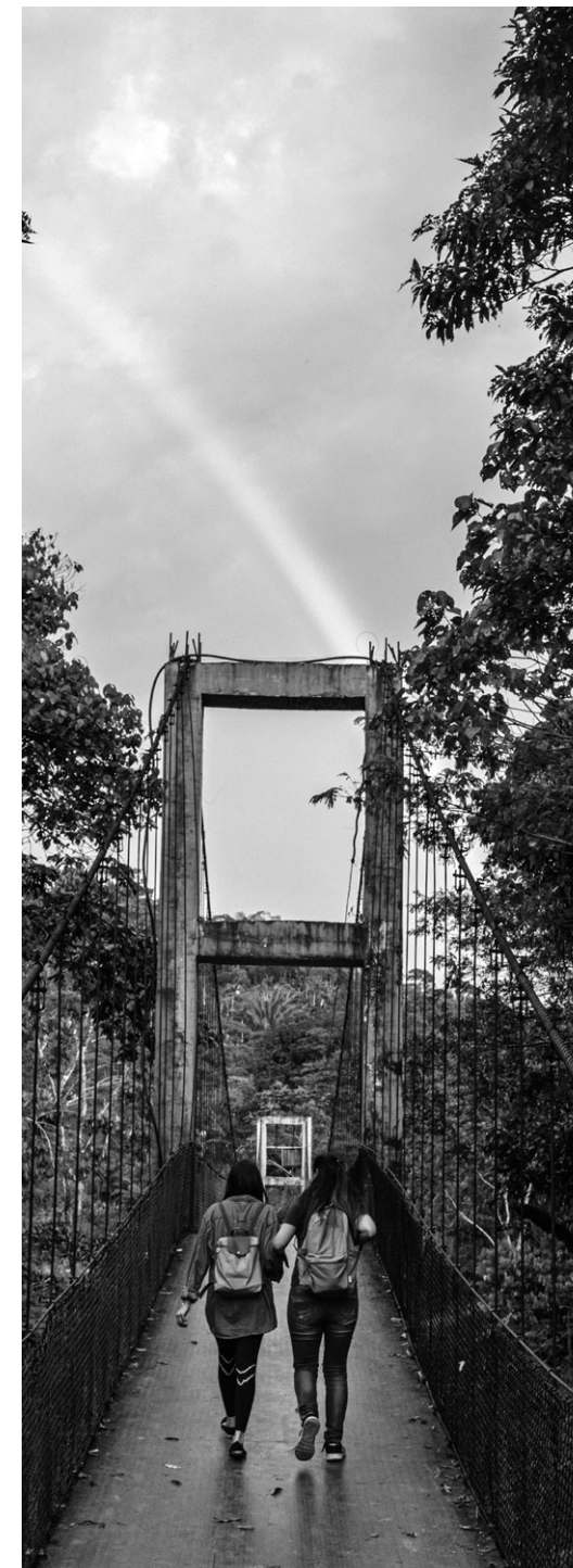
Figura 6: investigadoras cruzando el río