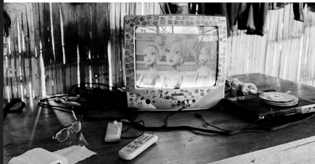
Figura 12: barbie en la televisión