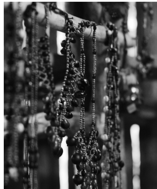
Figura 4: artesanías