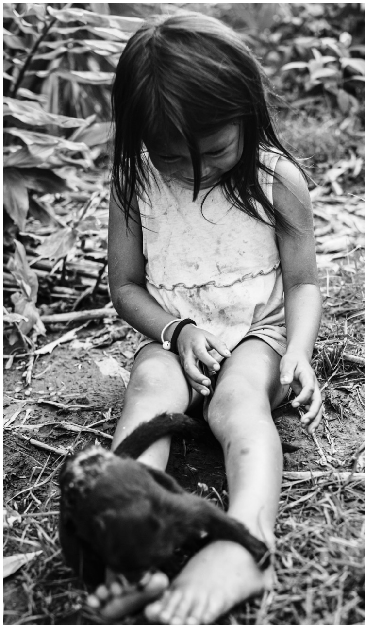
Figura 13: niña en su entorno comunitario