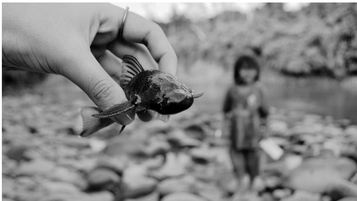
Figura 3: mano de la mujer con pez