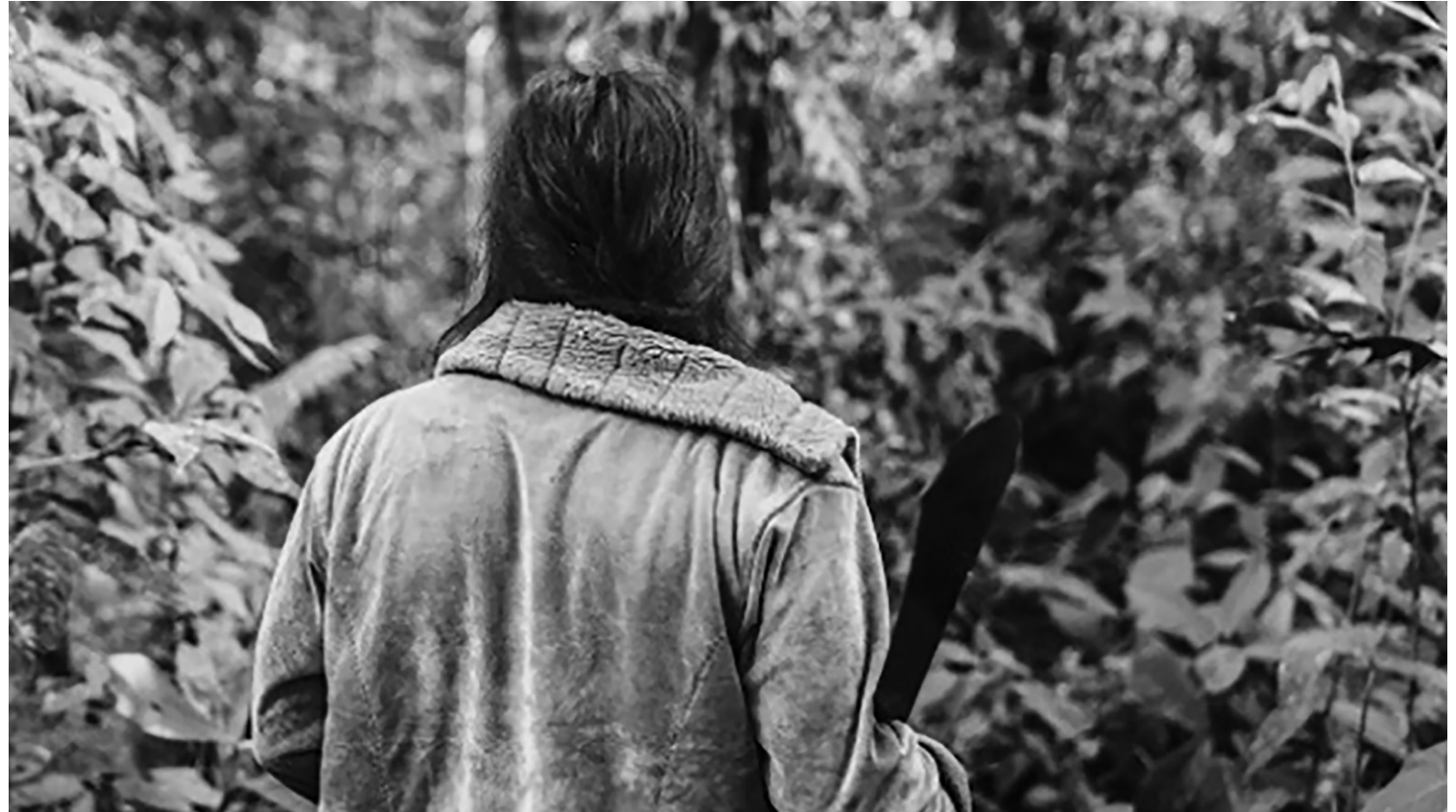
Figura 1: Mujer con machete

Finalmente queremos destacar la necesidad de visualizar el territorio en este tipo de estudios decoloniales por la capacidad que tiene de mantener vigentes discursos otros, saberes otros y prácticas otras . Se le asigna al espacio físico entendido como territorio la capacidad de mantener vivas estas formas otras de ser, permitiendo que sus identidades persistan y resistan a la influencia colonial. También se reconoce el peso simbólico y cultural que trae consigo el espacio. Durante esta experiencia hemos podido comprender el la construcción de fronteras simbólicas entre Vencedores y Puyo, la atribución de significados a cada territorio y creemos que es necesario profundizar en las hibridaciones y las formas de contagio cultural que se dan en las comunidades indígenas.