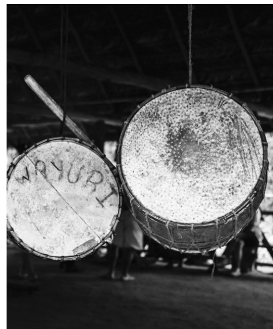
Figura 5: tambores con nombre Wayuri