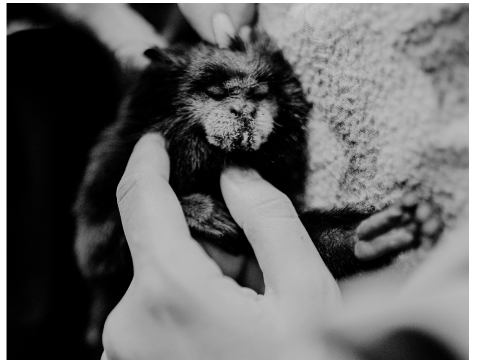
Figura 9: encuentros