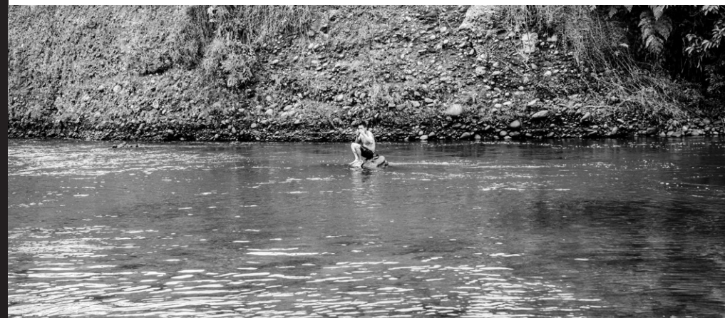
Figura 11: el río