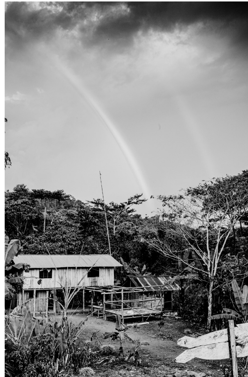
Figura 15: Wayuri en el encuentro del sol y el agua