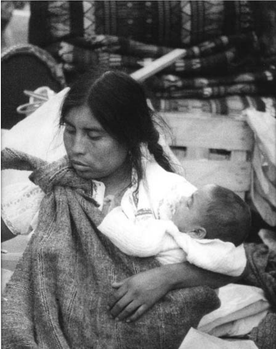
Enrique Guinsberg. Sin título . San Cristóbal de las Casas, México. 1992.