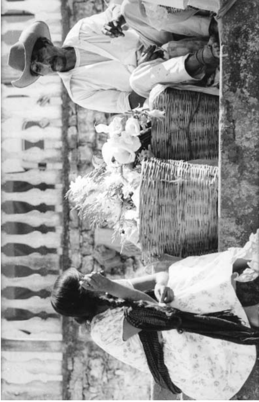
Enrique Guinsberg. Sin título . Cuetzalan. México. 1978.