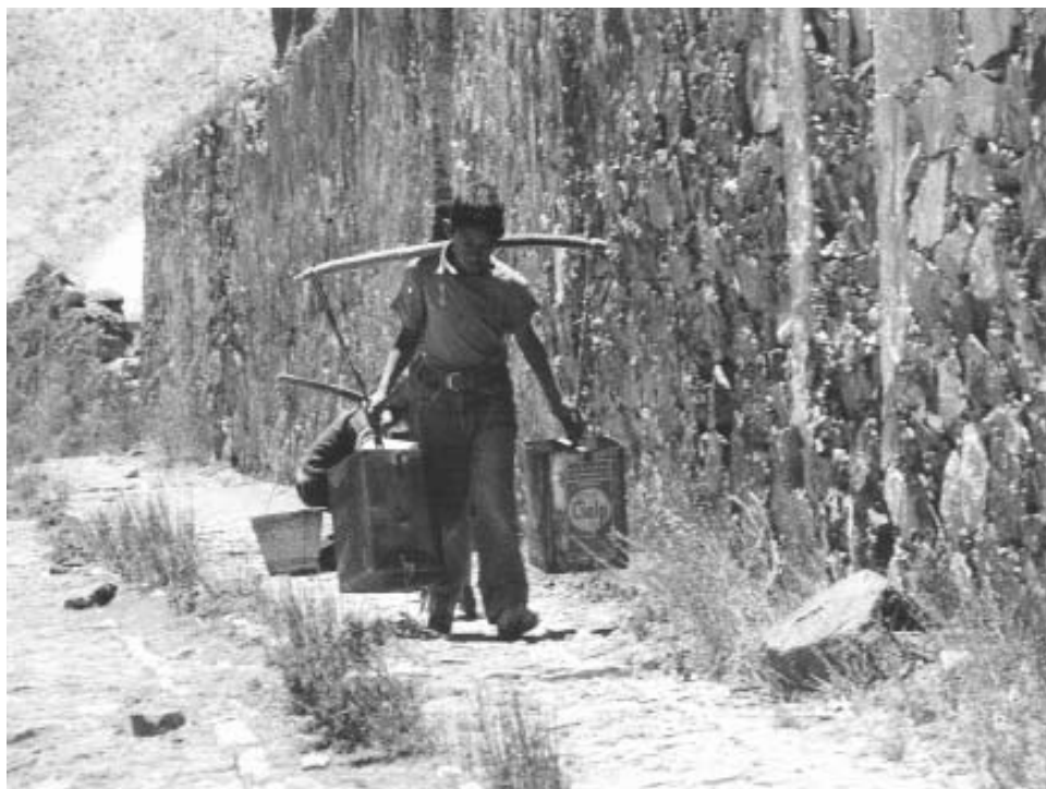
Enrique Guinsberg. Sin título . Real del 14, México. 1988.