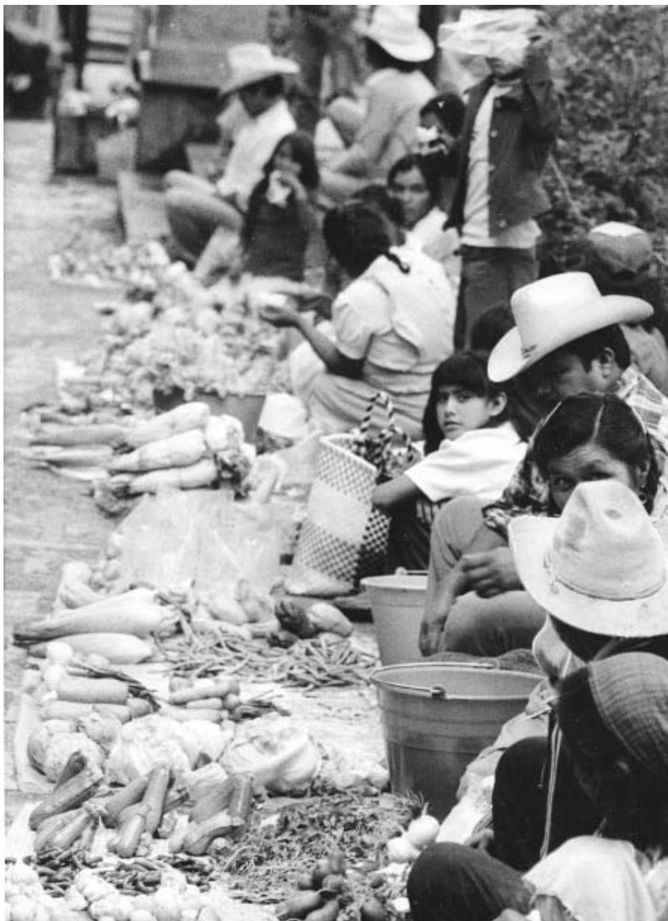
Enrique Guinsberg. Sin título . Guanajuato, México. 1984.